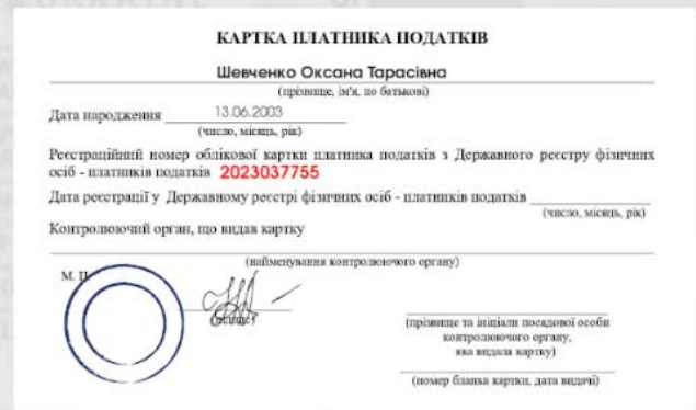
картка платника податків